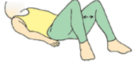
kalça adduktor germe