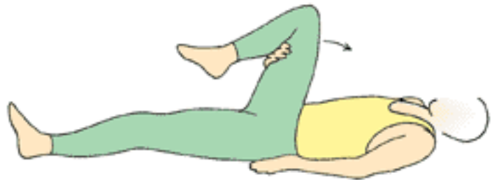
tek diz göğse değdirme