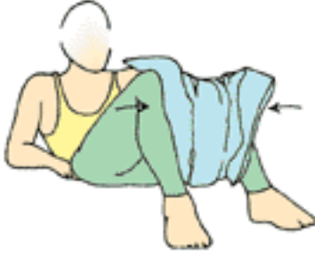
kalça adduktorlar için izometrik germe