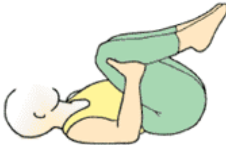
dizleri göğüse çekme