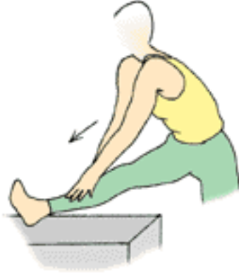
ayakta uyluk arka kaslarını germe